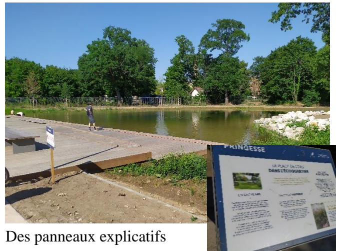
Des panneaux explicatifs