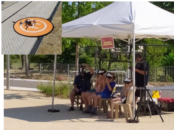
Survol en drone du parc Princesse