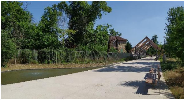
Des balades commentées, chasse au trésor, atelier vélo, IRSN