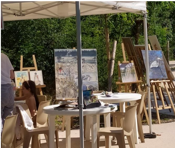
Atelier « les animaux fantastiques »